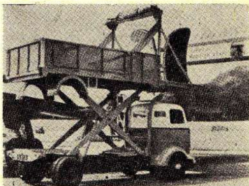
(Military Review, novembar 1956)

Britanci su izgradili specijalni kamion za utovar i istovar tereta koji se prenosi vazдушnim putem. Platforma kamiona se može podići do nivoa avionskog otvora za utovar — istovar, posredstvom »makaza« koje se pokreću hidrauličnim putem. Čelo ograde kamionske platforme spušta se i služi kao rampa koja može podneti teret veći od jedne tone. Platforma sa teretom od 3,5 tone se može podići najviše do visine od oko 3 m.