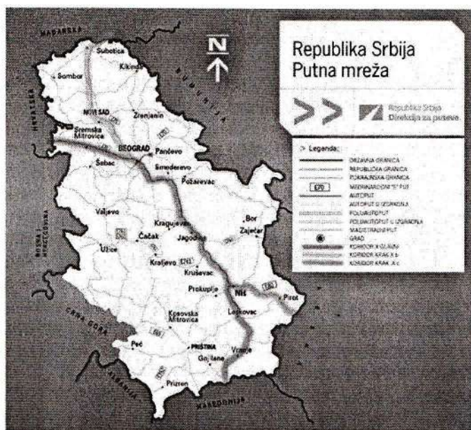
Слика 1 – Међународни путеви који пролазе кроз Републику Србију