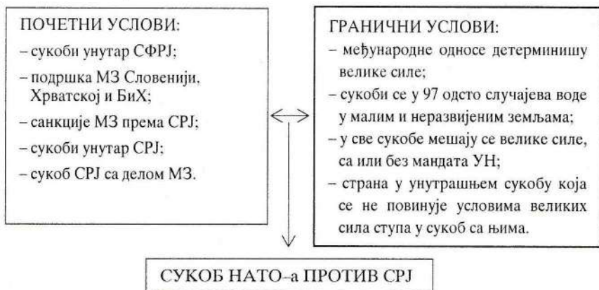
Однос почетних и граничних услова