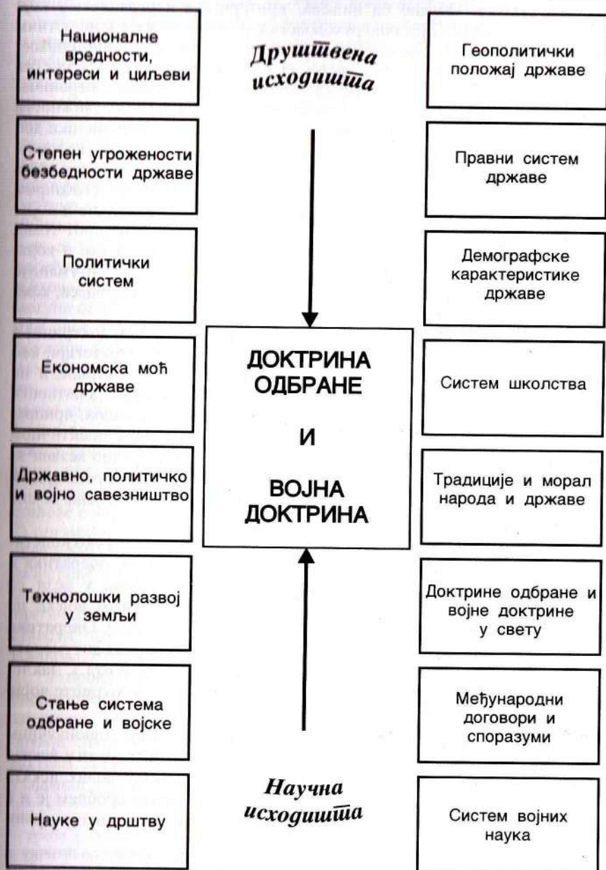
Исходишта доктрине одбране и војне доктрине