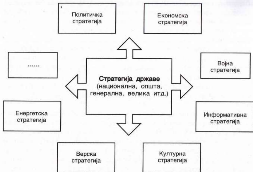
Међузависност стратегије државе и државних стратегија

стратегије државе треба да се плански и кординирано усмере сви умни, духовни и материјални потенцијали на поуздано предвиђање догађаја и активно учешће у њима, како би се обезбедио прогрес народа и утицало на повољно креирање положаја државе у регионалним и међународним оквирима. Стратегија државе је, дакле, свесно и планско хтење да се, на основу што поузданијих предвиђања, управља будућим догађајима.