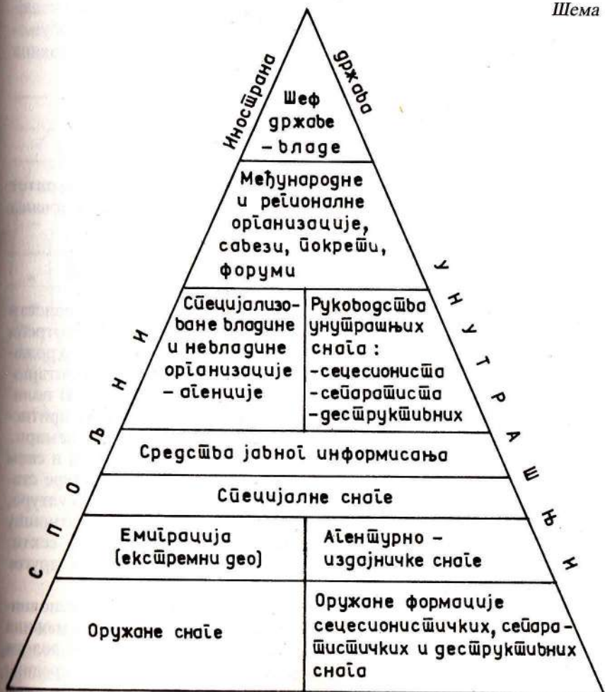
Носиоци и снаге угрожавања безбедности