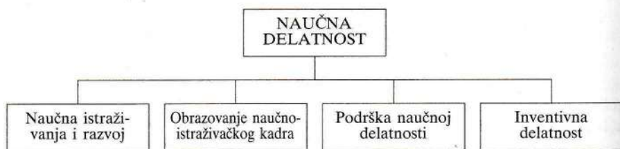
Sl. 1 Struktura naučne delatnosti