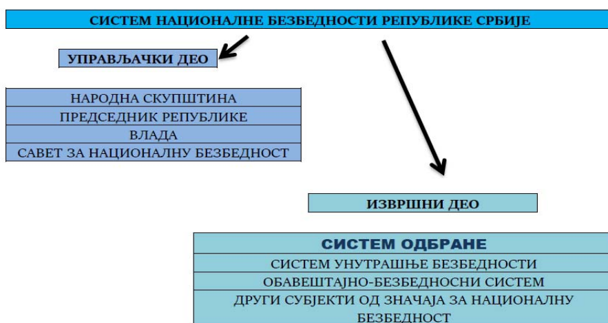
Слика 1 – Место цивилне одбране у оквиру система националне безбедности 9

Систем одбране је део система националне безбедности који представља јединствену целину, нормативно, структурно и функционално уређену, чији је циљ остваривање одбрамбених интереса Републике Србије у оквиру кога се, поред система војне одбране, налази и систем цивилне одбране Републике Србије, који је посредно препознат као саставни део система одбране Републике Србије. 8 Према Стратегији националне безбедности Републике Србије, управљачки органи система одбране су: Народна скупштина, председник Републике, Влада и Савет за националну безбедност, па се, следствено томе, може закључити да они представљају и управљачке органе система цивилне одбране Републике Србије.