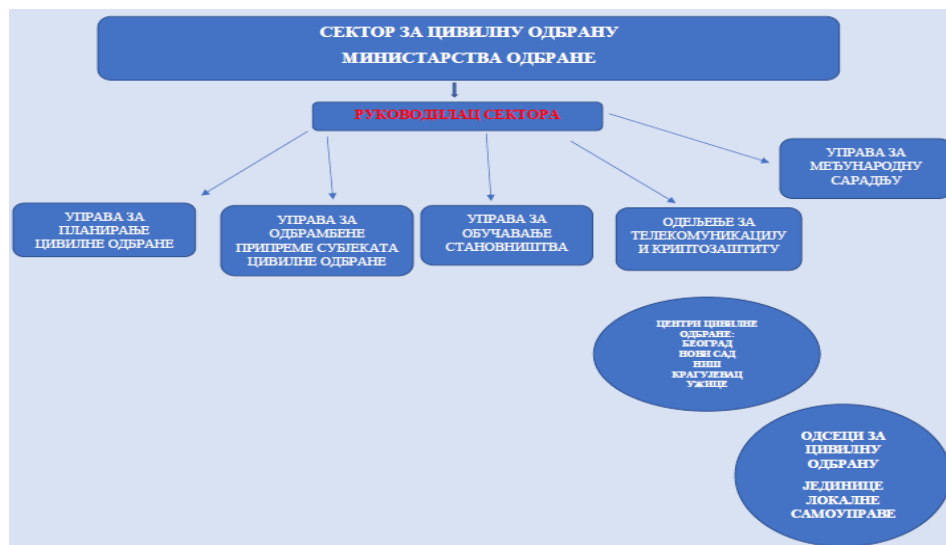
Слика 5 – Предлог организационе шеме Сектора за цивилну одбрану 26