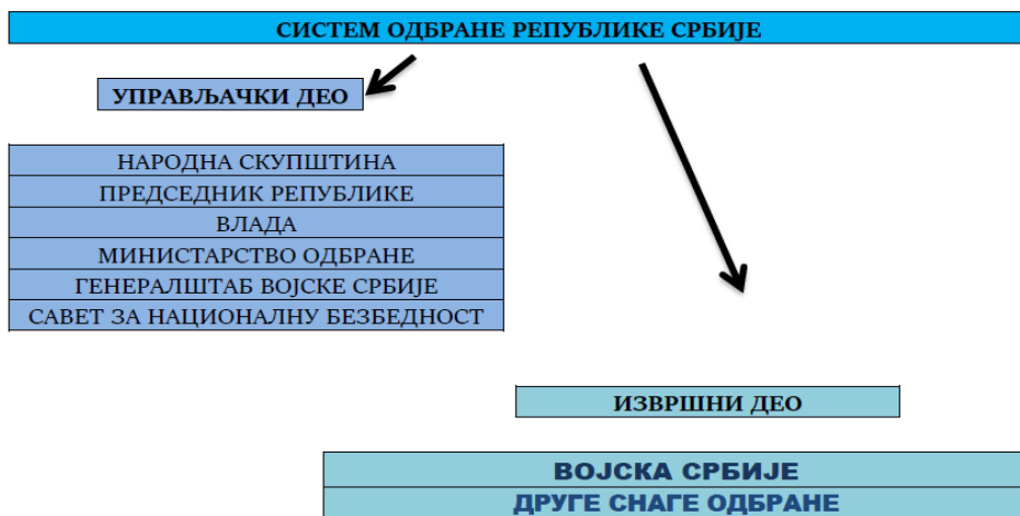
Слика 2 – Место цивилне одбране у оквиру система одбране

Извршни део система одбране, превентивним деловањем, ефикасном употребом снага и отклањањем последица угрожавања безбедности, обезбеђује заштиту и остваривање одбрамбених интереса. Структура извршног дела система одбране прилагођава се природи изазова, ризика и претњи. 17 Извршни део система одбране састоји се од Војске Србије и других снага одбране. Друге снаге одбране чине државни органи, органи државне управе, органи аутономних покрајина, органи јединица локалне самоуправе, привредна друштва, друга правна лица, предузетници и грађани који, у складу са законом, извршавају задатке припреме за одбрану и одбране (слика 2). Из наведених одредби може се видети да друге снаге одбране, у ствари, чине цивилну одбрану Републике Србије, па је сувишно да се називају новим именом у истом документу.