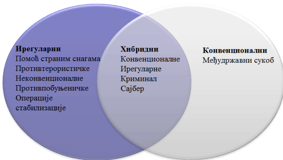
Слика 3 – Међусобни однос типова сукоба

– Неопходност прихватања нових идеја, нестандартних приступа и другачијег погледа.