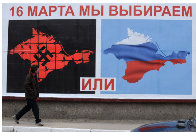
Слика 1 – Пропагандна форма позива за референдум о отцепљењу Крима од Украјине и припајања Русији