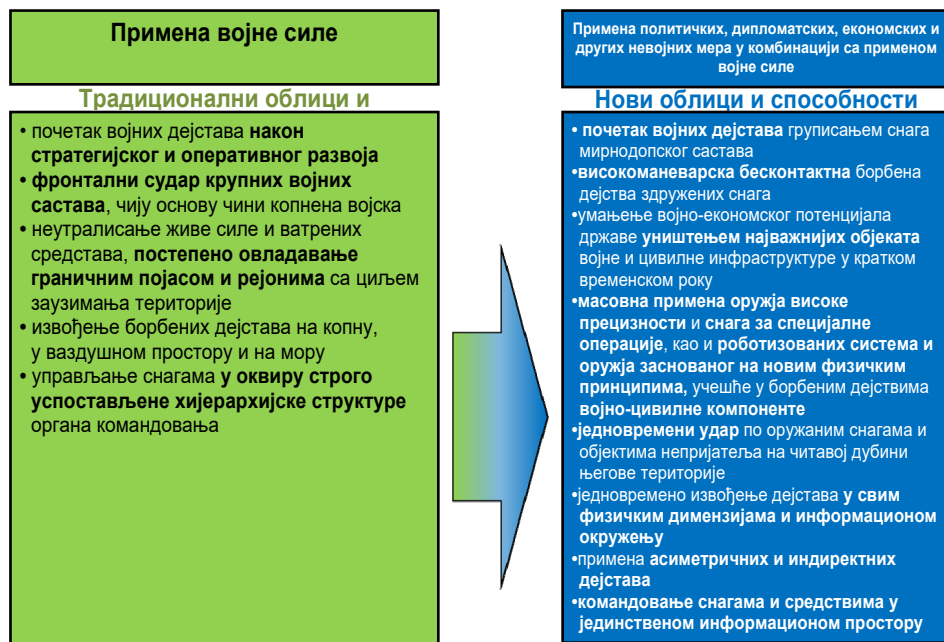
Слика 4 – Промена карактера оружане борбе 8

Совјетска армија је деценијама сматрала оружану борбу као основни садржај рата, што је било у потпуности погрешно. Због наведеног становишта није разматран утицај осталих инструмената моћи на СССР, попут дипломатије, економије и пропаганде. Као крајња последица дошло је до распада Варшавског уговора, а потом и СССР, а да ни једног тренутка није дошло до оружане борбе између СССР и НАТО, на челу са САД.