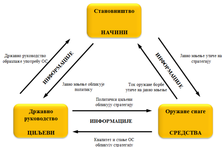
Слика 2 – Однос начина, средстава и циљева у хибридном сукобу 6