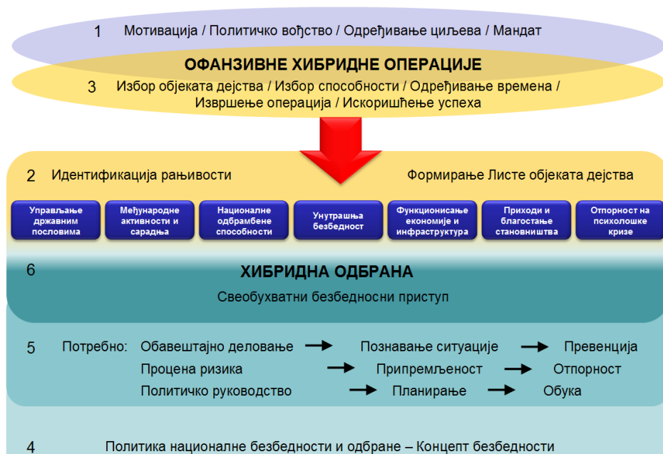
Слика 7 – Планирање и припрема хибридног напада (Висок ниво прегледа хибридног рата 11 )

Детаљније разматрање свих аспеката примене хибридног ратовања још увек није извршено, првенствено јер је његова примена од стране и Руске Федерације забележена тек протеклих година, до када је било једнострано позиционирано као својствено и приписивано, пре свега Западним силама, на челу са САД. Према ставовима одређених аутора може се закључити да се концепт хибридног ратовања састоји од три фазе, при чему се свака фаза састоји од три подфазе. То су: фаза припреме, фаза напада и фаза стабилизације.