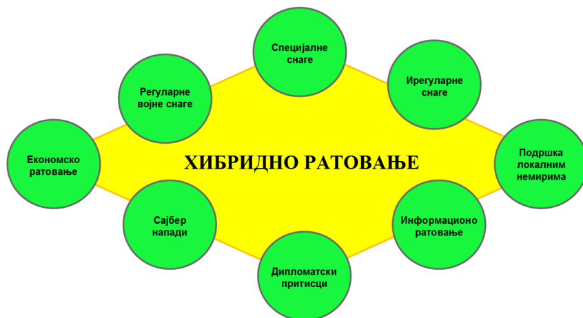
Слика 6 – Невојна средства хибридног рата 10