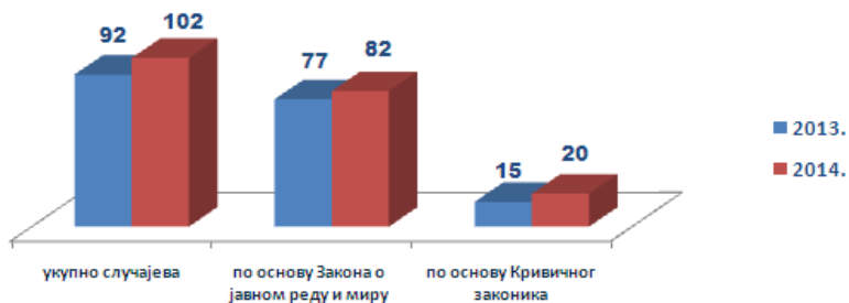
Слика 5 – Упоредни приказ броја ометања и напада на на полицијске службенике за период од 2013. до 2014. године

У анализираном периоду забележена су 102 (92) таква случаја, односно поднетих кривичних пријава по овом основу, од чега 82 (77) по основу Закона о јавном реду и миру, а 20 (15) по основу Кривичног законика.