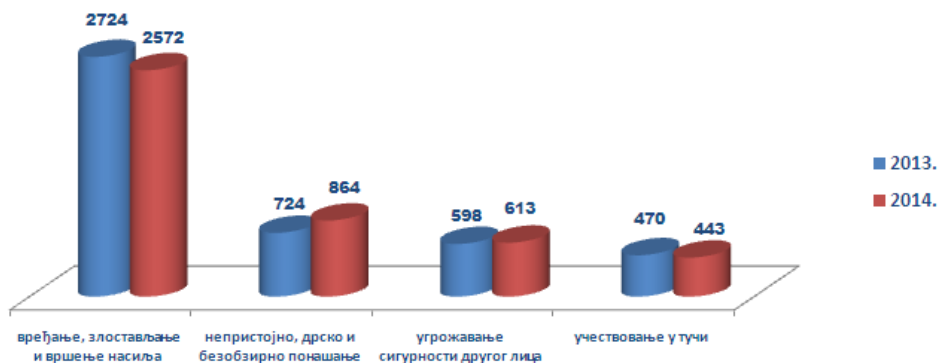
Слика 3 – Упоредни приказ броја најтежих прекршаја јавног реда и мира за период од 2013. до 2014. године

На следећој слици дајемо упоредни приказ броја најтежих прекршаја јавног реда и мира, за период од 2013. до 2014. године.