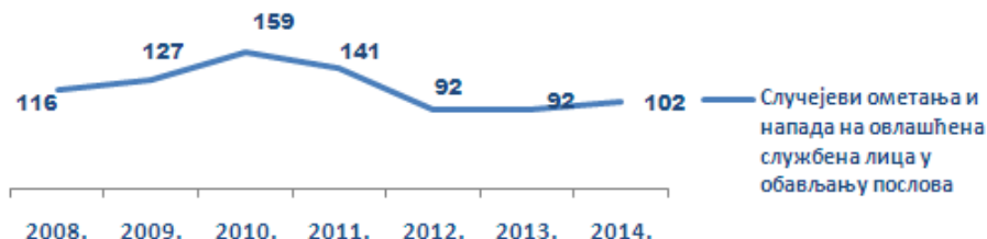
Слика 4 – Укупан број ометања и напада на овлашћена службена лица за период од 2008. до 2014. године

У току 2014. године, бележи се благо повећање броја ометања и напада на овлашћена службена лица у обављању послова безбедности или одржавања јавног реда и мира, што се види се у следећем графичком приказу.