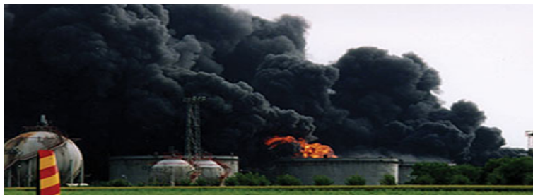
Slika 8 – Bombardovanje rafinerije nafte u Novom Sadu

Prilikom bombardovanja Novog Sada, pored rušenja sva tri mosta na Dunavu, glavna meta bila je rafinerija nafte koja je bila napadnuta 12 puta sa preko 250 projektila. Prema proceni stručnjaka iz rafinerije Novi Sad od 73.569 t nafte, izgorelo je 90%, izliveno je na zemljište 9,9%, dok je izliveno u kolektor i dospelo u Dunav 0,1% (Nežić, 2009).