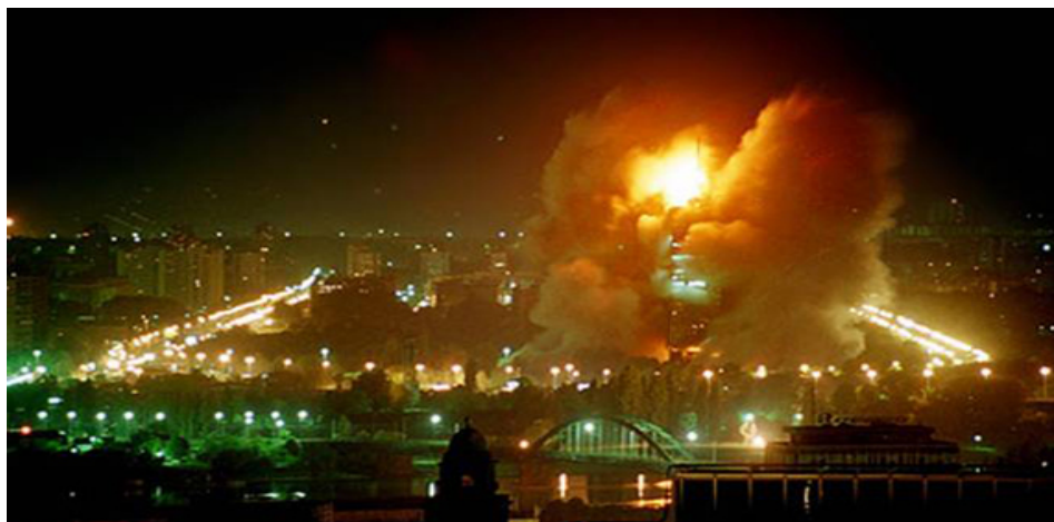
Slika 1 – Bombardovanje Beograda

U Kumanovu je, 9. juna 1999. godine potpisan Vojnotehnički sporazum kojim je bombardovanje okončano 10. juna 1999. godine.