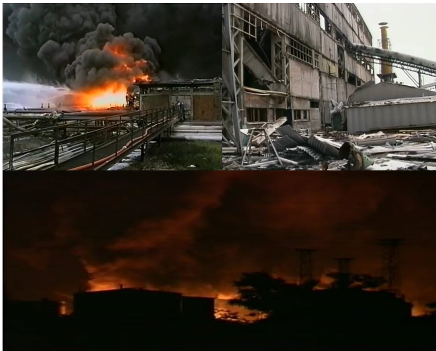
Slika 10 – Bombardovanje Pančeva

Najveće posledice po životnu sredinu ostavilo je bombardovanje ovog industrijskog kompleksa koji čini HIP „Azotara“, „Rafinerija nafte“ i HIP „Petrohemija“. Detaljniji pregled sa hronologijom, vremenom napada i opisom štete, događaja dat je u tabeli 2.