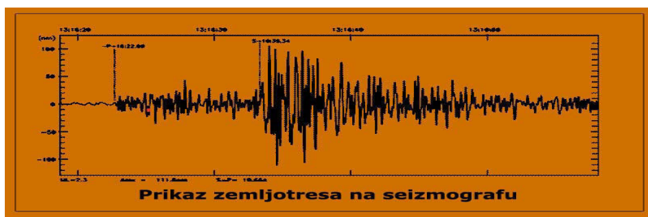
Slika 2 – Seizmogram

Iz dobijenih i obrađenih podataka, dobijenih iz seizmograma, naučnici mogu da odrede vreme, epicentar, i fokusnu dubinu, kao i tip prekida u kojem nastaje zemljotres, a isto tako mogu i da odrede količinu energije koja je proizvedena.