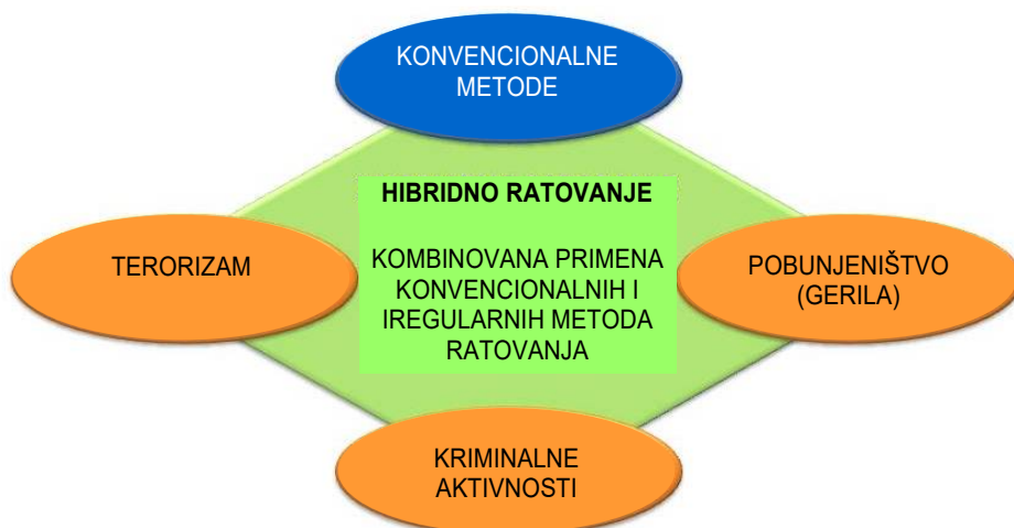
Slika 1 – Sadržaj koncepta „hibridnog ratovanja“ prema Hofmanovoj teoriji

Početak novog milenijuma sintagma „hibridno ratovanje“ sve više nalazi mesto unutar zapadnih vojnih krugova našta ukazuju već pomenuti radovi Duponta, Nemeta, Arkila ali i generala Konveja, admirala Rofheda i generala Alena, koji su je upotrebili u objašnjenju savremenih konflikata. 42 Ipak, najveći doprinos u korišćenju sintagme a, naročito, u utemeljenju teorije „hibridnog ratovanja“ pripada već pomenutom generalu Matisu i, posebno, potpukovniku Hofmanu. U članku Future Warfare: The Rise of Hybrid Wars iz 2005. godine, Matis upotrebljava sintagmu „hibridno ratovanje“ u objašnjenju kombinovanog načina ratovanja od strane iregularnih izazivača globalnih američkih bezbednosnih interesa i iznosi da takvo ratovanje predstavlja sintezu konvencionalnih i iregularnih (terorizam, pobuna i kriminalne aktivnosti) metoda. 43 U svim narednim radovima, Hofman će se pridržavati Matisovog određenja sadržaja „hibridnog ratovanja“ koji će predstavljati polazište njegovih kasnijih analiza savremenih ratnih sukoba.