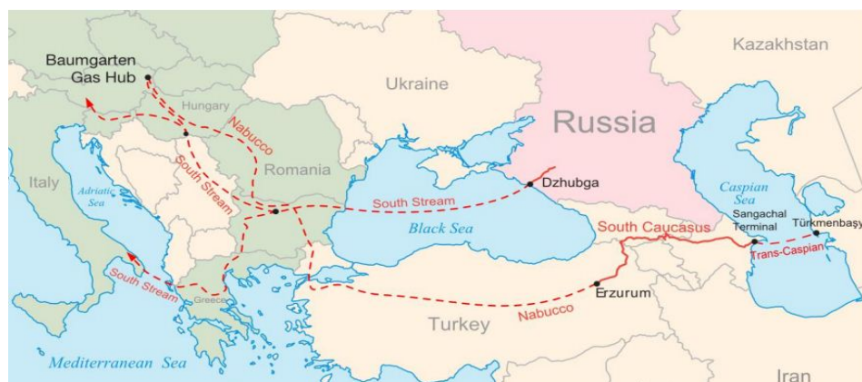
Slika 2 – Planirani gasovodi za snabdevanje jugoistočne Evrope 25

gućnosti da se obezbede snabdevači gasovoda, projekat je otkazan 2013. godine. Slična je i zamisao „Južnog koridora” koji ima za cilj da iz sličnih izvora dovede gas do Evrope i delimično smanji ruski energetski uticaj na Evropu. Sve su to modeli (slika 2) koji posredno mogu smanjiti ruski uticaj na evropsku energetska stabilnost.