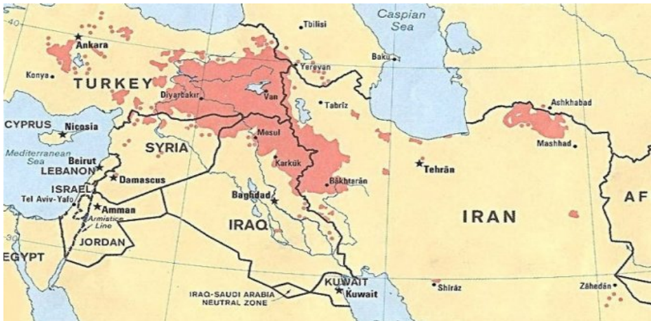
Слика 1 – Географска распрострањеност Курда на Блиском истоку 12

Курди су глобално најпознатији по чињеници да су на Блиском истоку највећа етничка група без државе. Многи који су одлучивали о судбини овог региона нису их разликовали од Арапа, Персијанаца, Турака и других, можда због тога што се реч „курд“ у арапском језику вековима користила како би се означили или описали номади, сточари, односно племена и народи који су насељавали планинско подручје између данашњих држава Турске, Ирана, Ирака и Сирије (слика 1).