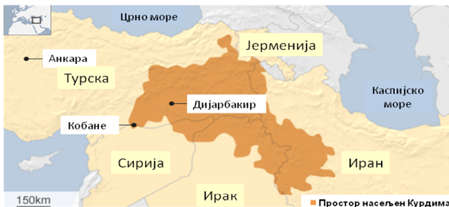
Слика 4 – Простор који насељавају Курди 32

Узевши у обзир географску и демографску распрострањеност Курда данас (слика 4) може се закључити да догађаји у региону имају велики утицај на курдско питање. Сукоб у Сирији је утицао на то да примирје склопљено између турске државе и Радничке партије Курдистана 2013. године буде прекинуто 2015. године.