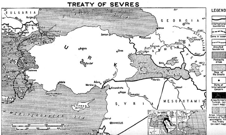
Слика 2 – Саставни део споразума у Северу – Мапа Турске са аутономијом Курдистана 21

Ипак, због великих територијалних губитака Турске, као и неслоге Курда око тога ко ће владати Курдистаном, овај споразум није прихваћен и није заживео, а у следећем и коначном споразуму Турске са коалицијом Антанте, који је потписан јула 1923. године, Турској су враћене територије и држава је добила садашње границе, без аутономних области (слика 3).