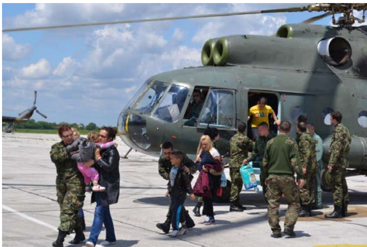
Евакуација угрожених цивила из Обреновца у мају 2014. године коју врше припадници Ваздухопловства Војске Србије (преузето са сајта Министарства одбране Р. Србије http://www.mod.gov.rs/sadrzaj.php?id_sadrzaja=6609 )