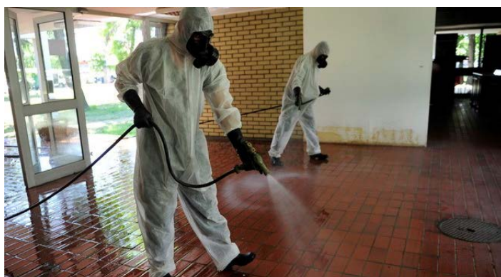
Припадници АБХО јединице врше дезинфекцију објекта након поплаве у Обреновцу

Може се констатовати да је улога војске у савременом систему координираног одговора на кризне ситуације значајна из више разлога. Први разлог је њена структура, обученост и опремљеност да правовремено, систематски, брзо и прецизно обави све радње које ће утицати на заустављање, управљање и санирање кризне ситуације, која је вишеслојан и сложен изазов, који се поставља пред локалну заједницу, регион или читаву земљу. Други елемент је садржан у мисији Војске која је јасно утврђена и прецизирана Стратегијом одбране и другим актима који предвиђају да Војска, поред класичне улоге у одбрани земље и учешћа у мировним мисијама, треба активно да учествује у санирању кризних ситуација, што је најдиректнији облик помоћи цивилном становништву. Она има капацитете и технику за управљање кризним ситуацијама великог обима, за шта је потребан велики број радних машина и превозних средстава, а уз то поседује логистичка средства, санитарске јединице, као и мобилна насеља, која у првом налету кризе могу бити прихватни центар за пострадао становништво (шатори, покретна кухиња, организација здравствене заштите – пољска болница и сл.).