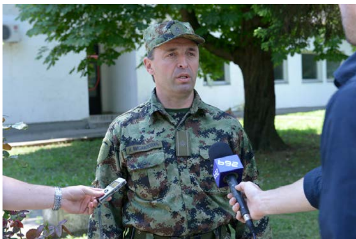
Сарадња војске и медија на кризној ситуацији – изјава старешине ангажованог на смештају угрожених цивила у војни објект