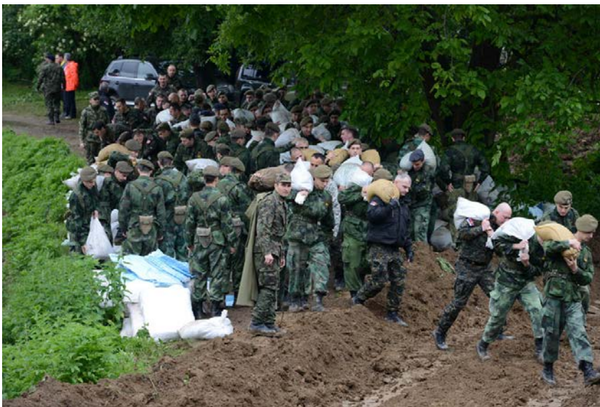
Ангажовање припадника Војске Србије на санирању кризне ситуације