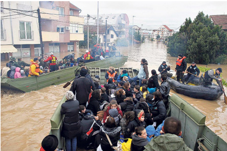
Евакуација угрожених цивила из Обреновца у мају 2014. године коју врше припадници Речне флотиле Војске Србије

Војска реагује на санацији кризне ситуације тек када је надлежне цивилне и војне власти ангажују, тј. након потребних наређења процењује се ситуација, организују штабови за праћење кризе, организују јединице, излази се на терен и приступа санацији. У зависности од природе кризне ситуације, ангажоваће се посебне јединице, јер, на пример, ако имамо еколошки инцидент са изливањем отровних или радиоактивних материја ангажоваће се АБХО јединица, ако је у питању поплава на терен излази инжињеријска формација и припадници Речне флотиле, док ће се за евакуацију становништва користити моторизоване јединице и сл.