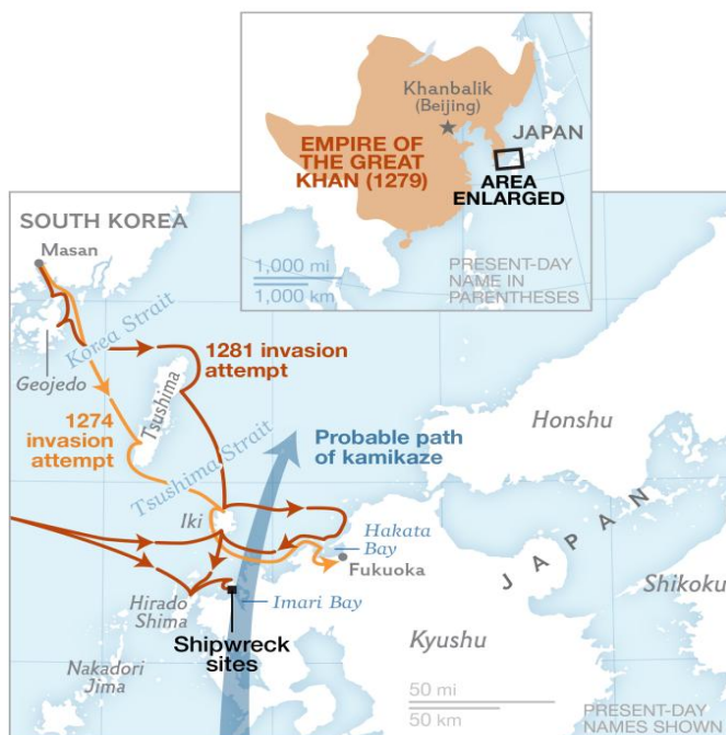
Слика 1 – Приказ прве и друге монголске инвазије на Јапан 3

Као илустрација може послужити и битка након које је постала позната јапанска реч „камиказа”. 1 У питању је догађај од пре 735 година, када су, 15. августа 1281. године, велике монголске снаге 2 под вођством Кублај-кана започеле свој поход на Јапан. Овај сукоб често се назива и „друга битка у Хаката заливу” (слика 1).