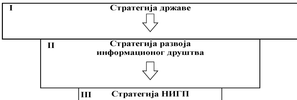
Слика 2 – Ранг Стратегије НИГП

Ако се прихвати хијерархија у полистратегичком систему који полази од стратегије државе, као опште стратегије, преко посебних до појединачних државних стратегија, тада Стратегију НИГП треба сврстати у хијерархијском рангу стратегија на непосредно нижи ниво од Стратегије развоја информационог друштва, као што је приказано на слици 2.