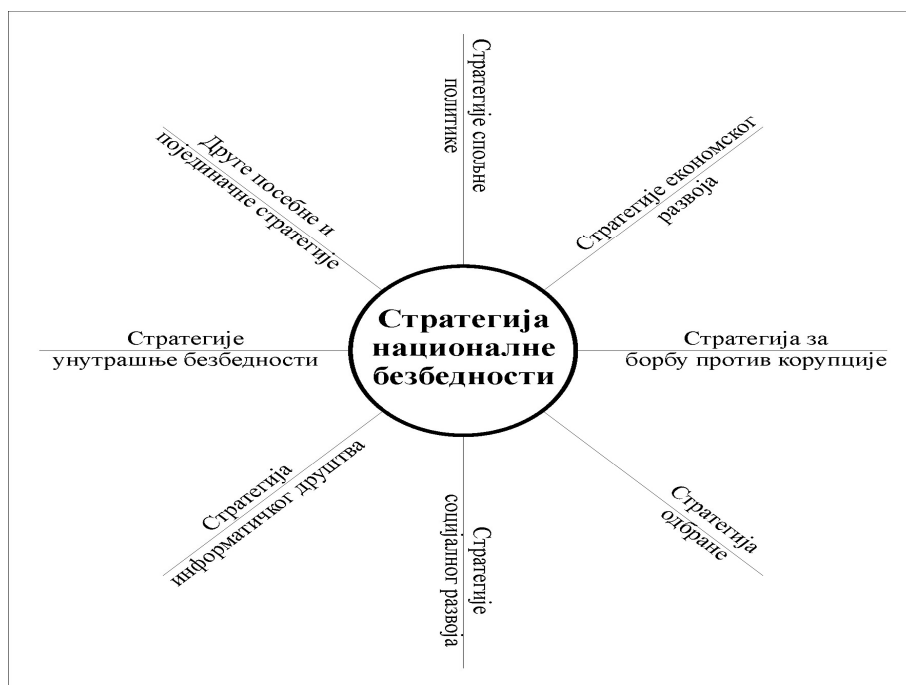
Слика 1 – Однос Стратегије националне безбедности Републике Србије према другим државним стратегијама

Чињеница да је законодавац Уставом предвидео да скупштина доноси Стратегију одбране, која је само једна од стратегија која се заснива на стратегији националне безбедности, говори о неразумевању односа између стратегија. То је још једна од чињеница која потврђује да полистратегијски систем у Србији није уређен, поготово није јасно хијерархијски уређен, што не значи да не постоји. На сајту Владе Србије, већ је речено, постоји преко 100 стратегија различитог значаја, општости и садржаја. Такође, на сајтовима појединих министарстава представљене су стратегије које су у надлежности тих министарстава (Министарство одбране; Министарство унутрашњих послова; Министарство правде; Министарство просвете, науке и технолошког развоја, и др.), али већина тих стратегија није повезана и не види се јасан хијерархијски ред или ранг међу њима, осим у стратегијско-доктринарним документима из надлежности министарства одбране. Стратегија одбране је, према рангу, на непосредно нижем хијерархијском нивоу од Стратегија националне безбедности. Законом о одбрани („Службени гласник РС”, број 116/07, 88/2009, 104/2009) дефинисано је да је Стратегија одбране највиши стратешки документ у области одбране, којим се дефинишу ставови о безбедносном окружењу интересима, мисијама и задацима Војске Србије, структура и функционисање система одбране.