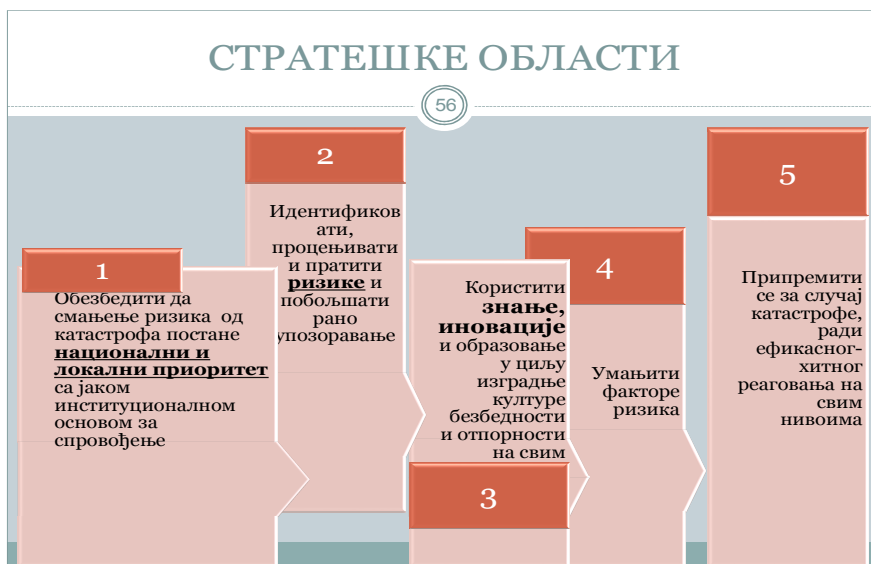
Слика 1 – Стратешке области

Националном стратегијом обезбеђује се испуњење препорука Европске уније за развој система националне заштите: успостављање институционалних, организационих и персоналних услова за спровођење заштите у ванредним ситуацијама; обезбеђење добро обучених кадрова; успостављање и оспособљавање постојећих ватрогасних и спасилачких јединица у свим местима за извршавање нових задатака; развијање способности да се у случају катастрофе одговори на најефикаснији начин, укључујући и отклањање последица катастрофа узрокованих терористичким нападом; обезбеђење материјалне помоћи за подршку реализацији Националне стратегије; оспособљавање ватрогасних и спасилачких јединица Министарства унутрашњих послова, ватрогасних јединица у привредним субјектима и ватрогасних јединица добровољних ватрогасних друштава, јединица цивилне заштите (специјализованих и јединица опште намене); оспособљавање грађана за деловање у ванредним ситуацијама, итд. Стратегија дефинише пет стратешких области које су приказане на слици 1.