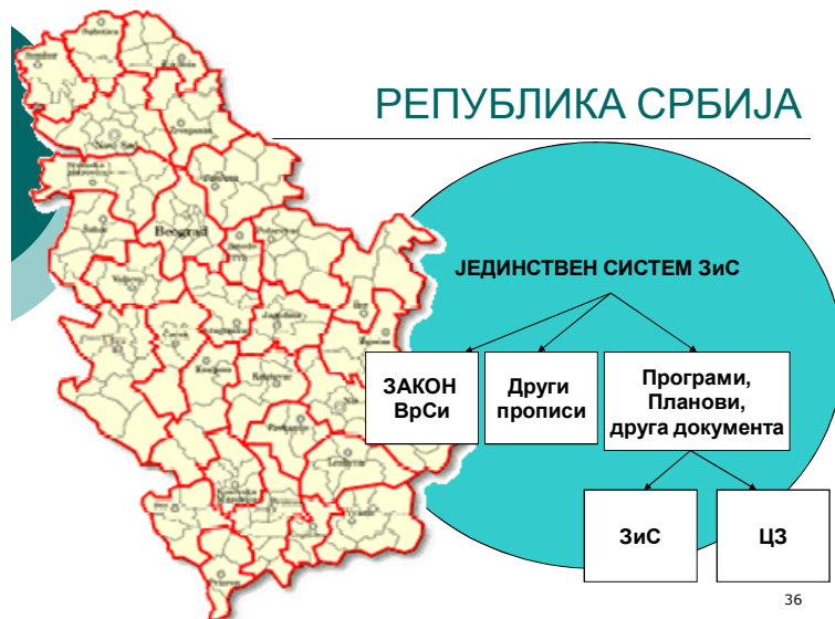
Слика 2 – Систем заштите и спасавања у Републици Србији