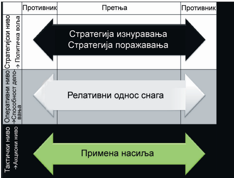
5 – Различно схватање претње према нивоу руковођења

На тактичком нивоу претња се манифестује реално и биће перципирана од свих као употреба силе у било којој оперативној сфери или у другим облицима државних инструмената моћи (нпр. USA FATCA – Foreign Account Tax Compliance Act). Мноштво ових манифестација ипак не значи да ће се оне и десити. Тек ако су ти поступци испољени у контексту државне политике, идентификују се као спровођење у дело намере противника, што носиоци наше извршне власти квалификују непријатељским актом. Тада је то довољан разлог за припрему противстратегије. Ово систематизовање дисциплинује интелектуално поштење, јер јасно ставља на знање шта представља непријатељски акт против сопственог суверенитета и шта треба да се сматра кривичним делом стварања хаоса. И грађанин и суверен укључени су у изразу стратегије. Али, то се не сме дегенерисати управним актом.