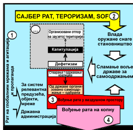
2 – Етапа развоја стратегије поражавања