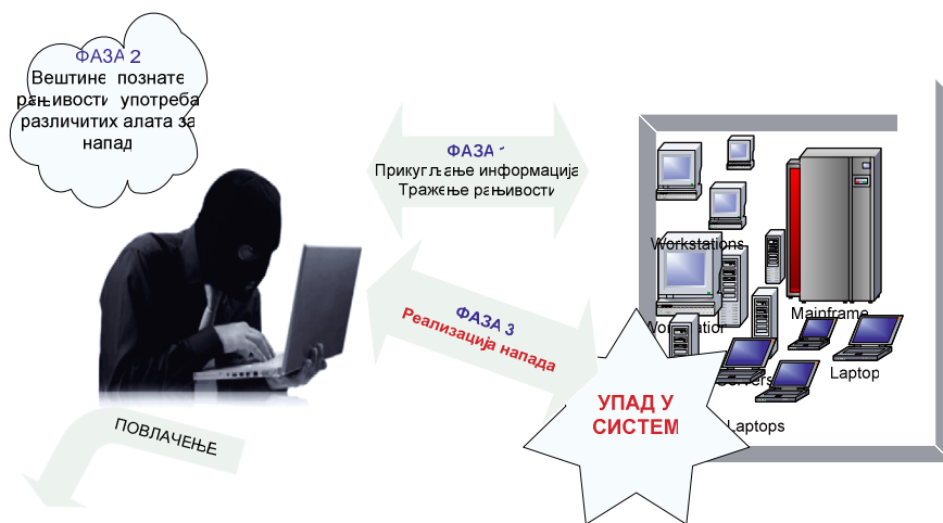
Слика 5 – Фазе сајбер напада 25

Суштина сајбер претњи, исказана кроз сајбер напад (слика 6), подразумева да је потенцијални нападач у испољавању сајбер претње иницијатор активности, а претња се манифестује употребом савремене технологије у неколико фаза. Средство и циљ напада у сајбер простору представљају рачунар, информациона технологија и подаци.