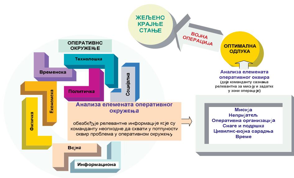
Слика 2 – Димензије оперативног окружења и елементи оперативног оквира 12

Оперативни оквир је структурно ужи појам и, практично, представља „призму” кроз коју се посматра и анализира оперативно окружење и утицај, који испољавају његове димензије, на елементе оперативног оквира и ток извођења операције. У општем случају, оперативни оквир је организовање снага (сопствених и суседних) и расположивих ресурса, у простору и времену, у складу са сопственим намерама и у односу на непријатеља. У контексту конкретне операције, оперативни оквир чине „(...) мисија, непријатељ, оперативни распоред сопствених снага и подршке, оперативна организација простора, цивилно-војна сарадња и време.” 13