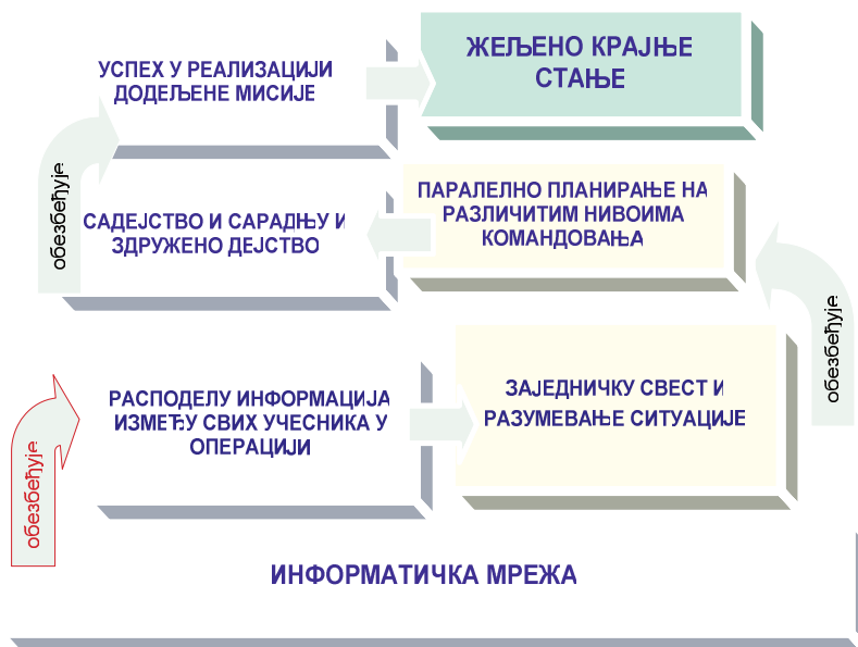
Слика 3 – Приступ заснован на информатичкој мрежи 20

У тако одређеном сајбер простору доносиоци одлука имају свеобухватну слику оперативног окружења и оперативног оквира будућих операција. Употреба снага заснована на информатичкој мрежи (слика 3) омогућава једновременост у коришћењу информација, уштеду времена у процесу планирања операција и усклађеност у извршавању задатака, што, у коначном, доводи до успеха у реализацији додељене мисије и остварење жељеног крајњег стања.