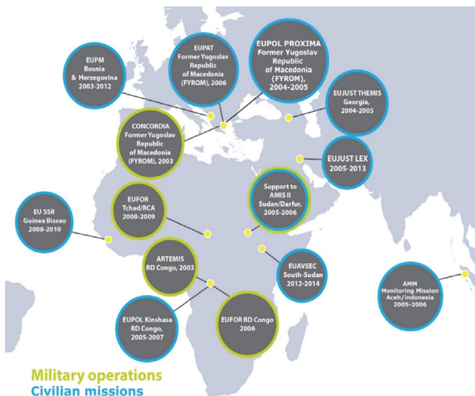
Slika 2 – Završene misije i operacije EU (zelenom bojom označene su završene vojne misije, a plavom završene civilne misije EU) 10

Sa slike 2 vidi se da su završene misije koje imaju vojne ili odbrambene posledice, odnosno koje potpadaju pod finansiranje zajedničkih troškova mehanizmom ATHENA: