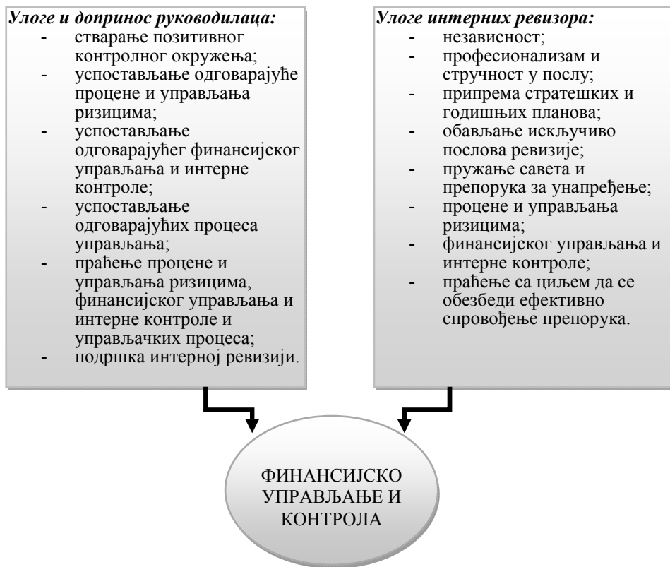
Слика 1 – Веза између финансијског управљања, интерне контроле и интерне ревизије

На слици 1 приказана су сва три елемента интерне финансијске контроле у јавном сектору са описаним улогама у процесу финансијског управљања и контроле јавних расхода и издатака, као и веза између финансијског управљања, интерне контроле и интерне ревизије.