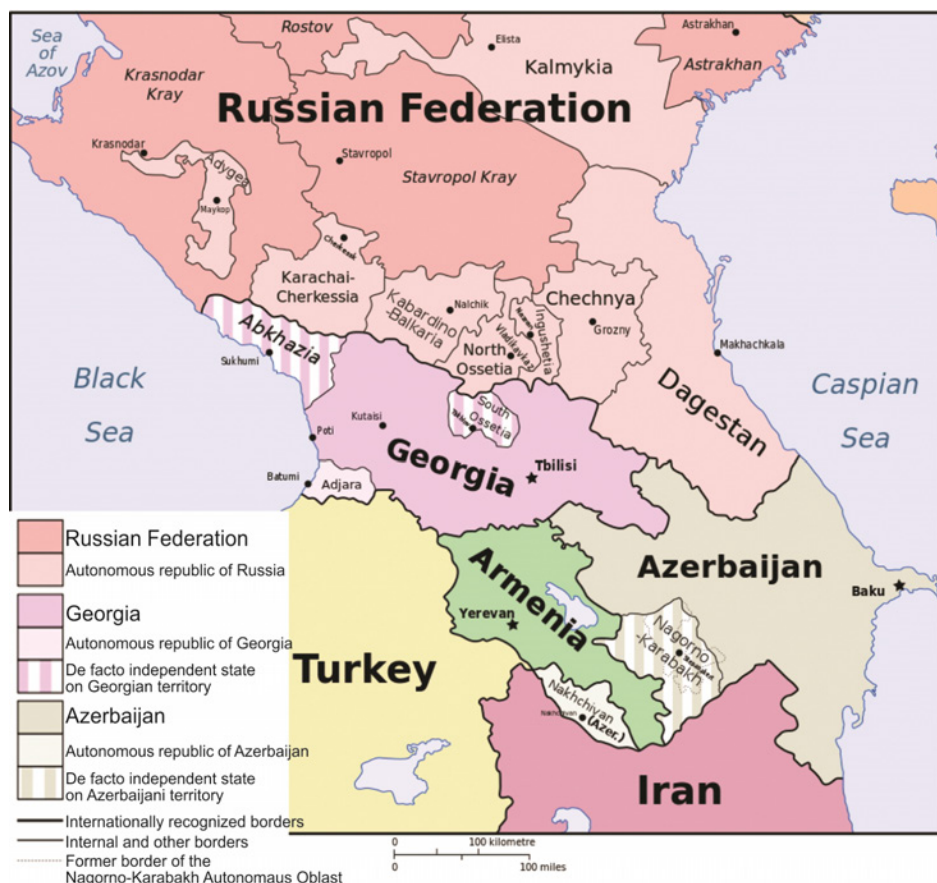
Карта 2 – Закавказје 45

Европска унија суштински није јединствена по питању Украјине, а истовремено Сједињене Америчке Државе настоје да управљају дестабилизацијом Украјине и буду медијатор у том процесу. Дугорочно, питање Украјине се промовише као камен спотицања и извор сукобљености ЕУ и Русије, а такав развој ситуације нанео би највеће последице првенствено европским и азијским државама. У глобалној стратегији надметања, Немачка и Русија биле би изложене највећим последицама. Међутим, изгледа да су обе земље свесне тога и вуку промишљене и прагматичне политичке потезе.