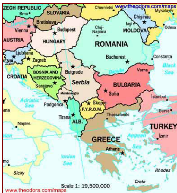
Слика 2 – Политичка карта Балкана

Промене у Источној Европи и бившем СССР-у извеле су на историјску сцену низ супротности и интереса који су у ранијем периоду били мање или више контролисани, попут међунационалних односа, граничних питања, положаја националних мањина и сл. У контексту такве стварности отпочели су процеси европских интеграција, у средишту којих је Европска унија, али и распад бивше Југославије и неких држава источног блока.