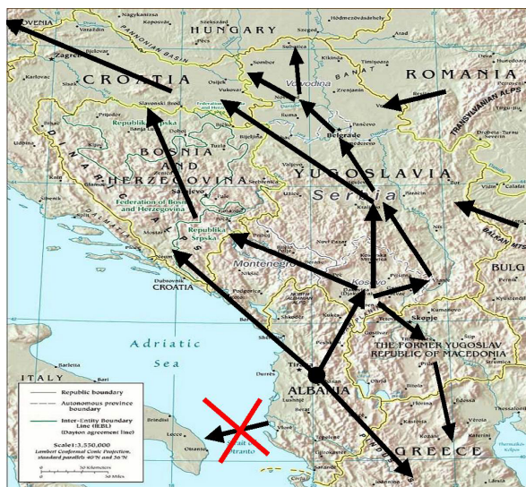
Слика 5 – Пuteви кријумчарења дроге на Западном Балкану

Могућности за супротстављање трговини наркотицима налазе се у тесној сарадњи безбедносних служби и тужилаштва земаља региона. Неки од облика сарадње представљају и билатерални уговори о сарадњи тужилаштва за организовани криминал закључени 2010. и 2011. године између Србије, Хрватске, Црне Горе и Македоније.