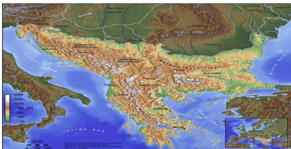
Слика 1 – Географска карта Балкана

„племенска непријатељства” често била подстицана од неуких дипломата из далеких центара који су стварали државе, делили народе и прекрајали границе – са смртоносним последицама. Западњаци, генерално лоше обавештени о балканским питањима, одушевљени су, али понекад и заплашени Балканом. Ипак, Балкан, као посебна мешавина народа и вера, са великом културном, етничком, верском, друштвеном, привредном и географском разноврсношћу, има другу примамљиву, непознату страну, која га чини узбудљивом дестинацијом за уживање, са древним налазиштима, највећим остварењима средњовековног и оријенталног градитељства, као и изванредним сведочанствима владавине Хабзбурга, јединственом балканском гастрономијом, што све скупа чува наизглед непромењени дах прошлости.