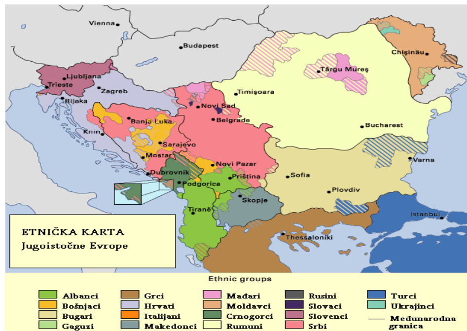
Слика 3 – Етничка структура

Како се већина држава на простору Балкана још увек налази у фази постсоцијалистичке транзиције и опоравка након оружаних сукоба, а има за прокламован циљ достизање демократских вредности савременог друштва, јасно је да су још увек присутни безбедносни ризици. То пре свега јер на релативно малом простору живи десет народа и више етничких група (припадника три највеће конфесије), са још увек присутним осећањем појединих народа да им је учињена „неправда“ после разграничења државних територија под утицајем великих сила. Етничка структура и испреплетаност животног простора најбоље се види на слици 3. 4