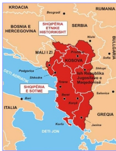
Слика 1 – Мапа „Велике Албаније“