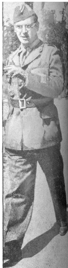
генерал Владимир Велебит

Иначе, прву мисију Народноослободилачке војске Југославије код савезничких снага представљала је „Команда