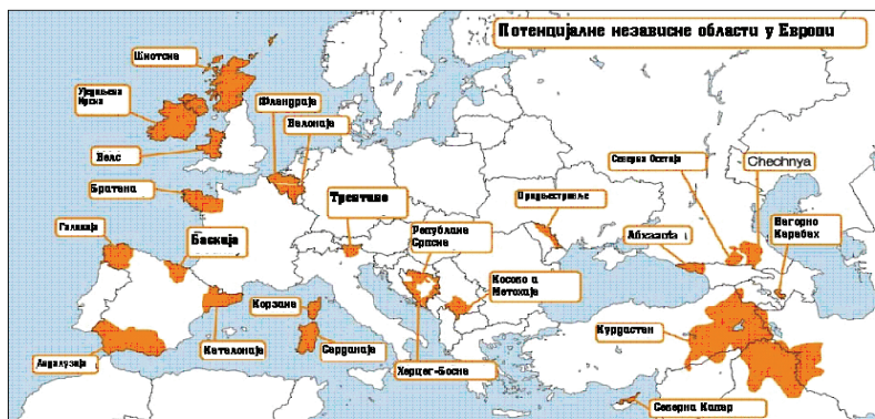
Слика 1 – Мапа потенцијалних независних области у Европи 11

Са правног становишта, већина држава у свету гледа на косовски преседан са великом сумњом и одбојношћу, јер им је примарни интерес очување суверенитета и територијалног интегритета. Наиме, на планети постоји најмање 2000 етничких група које теже вишем степену аутономије или самосталној државности. Уколико би се по узору на Косово формирале државе са територијом и бројем становника приближно истим или сличним Косову (дакле 2 милиона становника), на свету би постојало 4000 држава, што би водило у потпуну анархију у међународном поретку; сукоби би постали свакодневица, а нестабилност би се проширила на сваки делић Земљине кугле. О постојању бројних сепаратистичких подручја која постоје само у Европи најбоље сведочи слика 1.