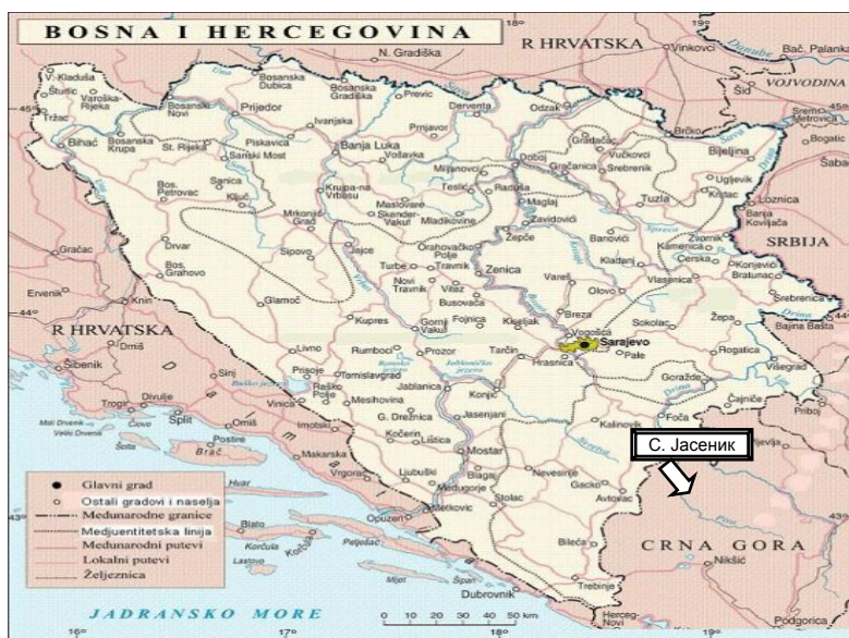
Слика 2 – Положај села Јасеник код Гацка, родног места Саве Владиславића

Савин отац Лука био је угледан трговац који је право насељења у Дубровник добио после великог земљотреса 1667. године. Сава је у овом граду републици стицао образовање. Претпоставља се да се школовао и духовно формирао и у Млецима. У свом завештању он открива податак да је од оца Луке добио почетни капитал да би започео самостално бављење трговачким пословима у Цариграду. Касније је истакао да је оцу вратио целокупну позајмицу.