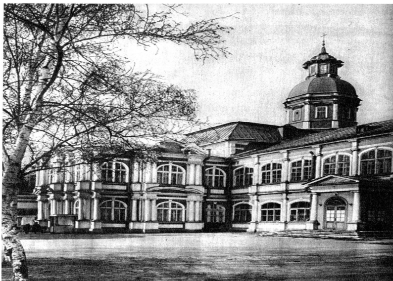
Слика 4 – Благовештенска црква у којој је сахрањен Сава Владиславић

Убрзо се повукао из јавног живота. Пошто је за неколико година изгубио сина и три ћерке запао је у здравствену кризу са психичким проблемима, да би убрзо умро. Сахрањен је у Благовештенској цркви Александра Невског у Петрограду (сл. 4), где су сахрањени и чланови царске породице.