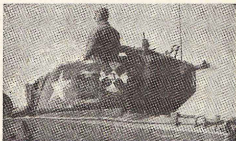
Sl. 4 — Treći tenk 2 voda

nalazi na poklopcu za municiju, pokazuje 2 odeljenje. U borbi, poklopac se zatvara ili se oznaka pokriva, da ne bi došlo do identifikacije od strane neprijatelja.