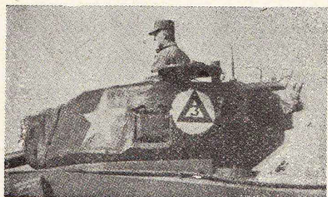
Sl. 3 — Treći tenk 3 voda