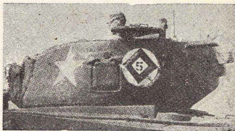
Sl. 2 — Peti tenk 4 voda

Za bolju kontrolu iz vazduha, poklopac na tenkovskoj kupoli obojen je iznutra istom oznakom, ili oznakom odeljenja u okviru voda. Ako se oznaka nalazi na poklopcu komandira tenka, ona pokazuje tenk 1 odeljenja voda, a ako se