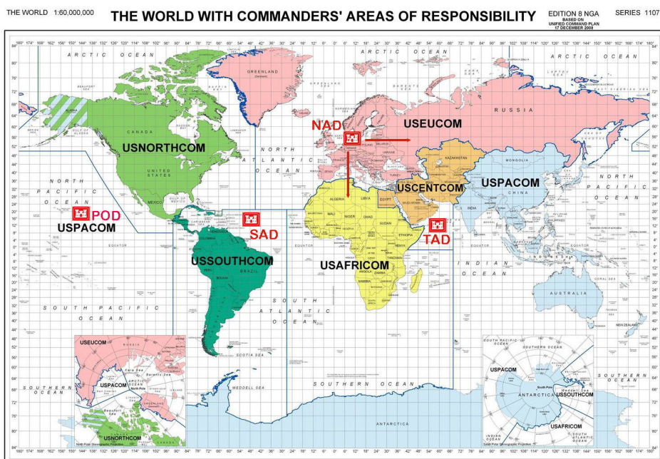
Зоне регионалних команди

Целокупне оперативне снаге САД (активна војска) груписане су у десет обједињених (здружених) борбених команди – шест регионалних и четири функционалне. Регионалне команде су: Централна, Европска, Пацифичка, Северна, Јужна и Афричка, а функционалне: Стратегијска, Здружених снага, Команда снага за специјалне операције и Транспортна команда.