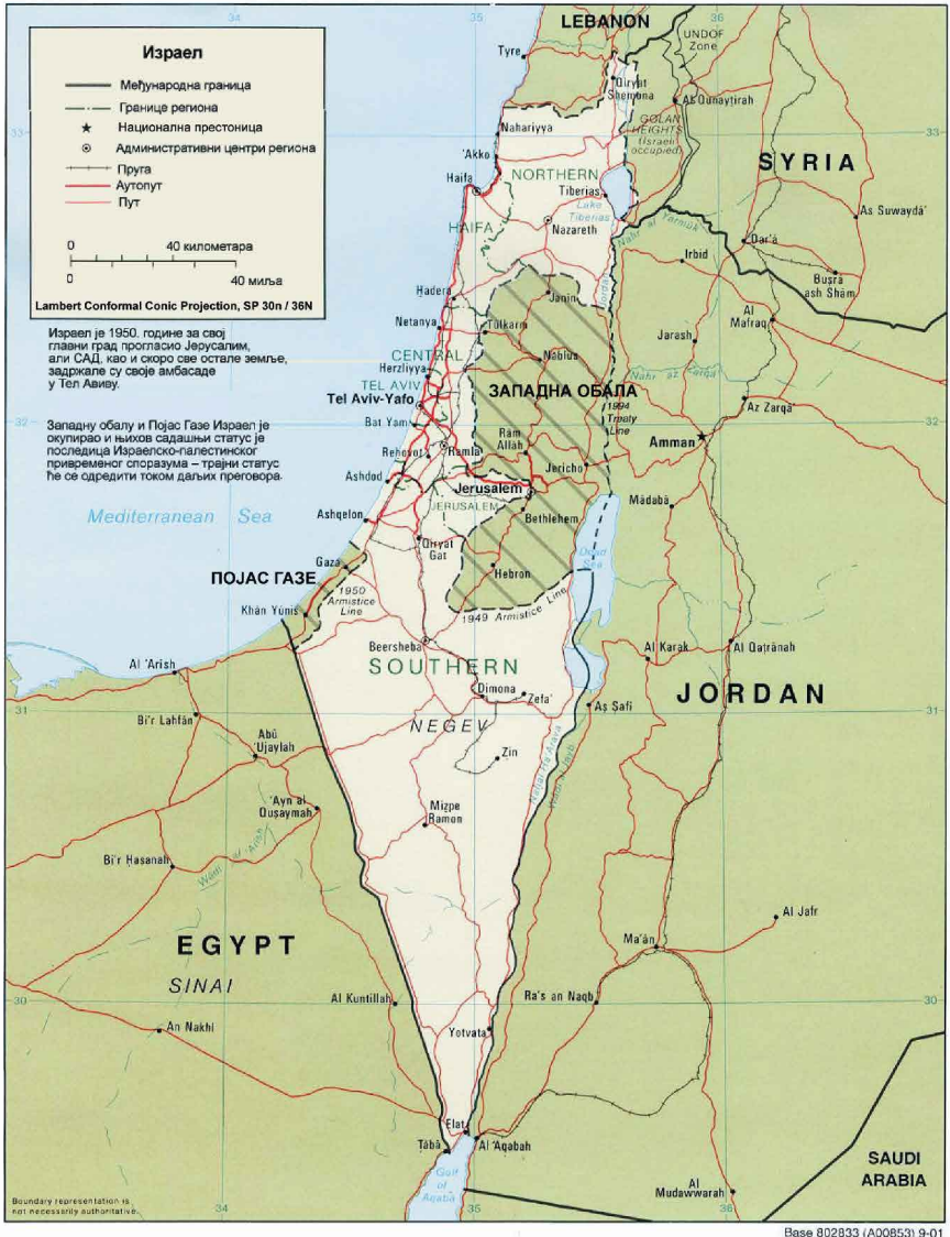
Политичка карта Израела (Извор: Perry-Castaneda Library Map Collection) http://www.lib.utexas.edu/maps