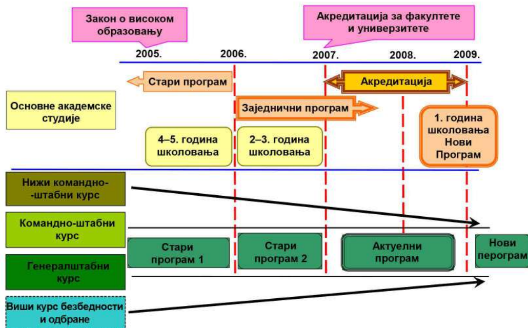
Слика 5 – Реформа високог војног образовања

У процесу реформе једно од кључних места заузима и реформа усавршавања официра и подофицира. То подразумева развој курсева усавршавања који треба да обезбеде оспособљавање за дужности и развој каријере. Курсеви усавршавања официра су у текућој години темељно прерађени, након чега следи успостављање потпуно новог модела усавршавања са новим садржајима. И модел и садржаји су у складу са новом организацијом Војске, мисијама, задацима и доктринама, а засновани су на искуствима из иностраних војнообразовних система и новом Упутству за оперативно планирање и рад команди у Војсци Србије. Према новом моделу усавршавања, након Војне академије која оспособљава за дужности командира вода, уследио би Нижи командно-штабни курс за командире чета, Командно-штабно усавршавање за команданте батаљона, Генералштабно усавршавање за команданте бригада и Виши курсеви из безбедности и одбране који би били намењени за највише дужности у Војсци, Министарству и одговарајућим цивилним структурама. Посебна пажња треба да се посвети курсирању лица ван Министарства одбране, која по положају и функцији имају потребе за одређеним нивоом знања из безбедности и одбране. Та лица доносе одлуке од значаја за систем одбране.