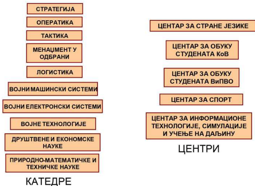
Слика 3 – Катедре и центри Војне академије

Војна академија је са неким факултетима Београдског универзитета развила Заједничке студијске програме који ће студентима уписаним на студије по тим студијским програмима да обезбеде диплому препознату и признату у друштву. Заједничке студијске програме реализују заједно факултети и Војна академија, ангажовањем својих наставника и коришћењем кабинета и наставних материјалних средстава. Заједнички програми су одлично решење до потпуне акредитације Војне академије, које треба да обезбеди делу студената друштвено признате дипломе, уз квалитетно образовање и оспособљеност за почетне дужности у Војсци Србије.