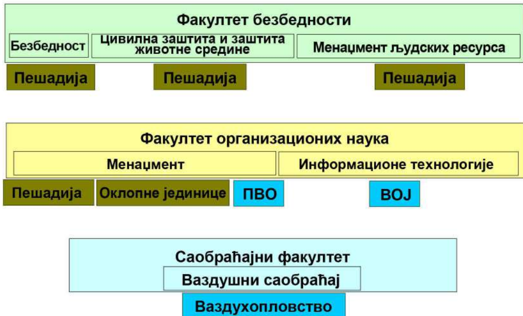
Слика 4 – Заједнички студијски програми

задржало би се једно језгро будућих кандидата за Војну академију, који би у свему били изједначени са кандидатима из цивилних средњих школа, али би били припремани за војни позив. Искуство, из претходног периода, показало је да овакав облик школовања треба да се задржи.