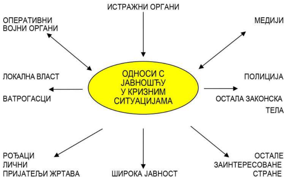
Приказ различитих група укључених у кризну ситуацију

Треба имати у виду да ће интересовање медија потрајати. Критички коментари могу изненада да се појаве знатно касније и треба на њих спремно одговорити. 31 После ванредног догађаја, у смиреној атмосфери, потребно је сакупити све материјале за документацију и анализу. Ваљало би организовати састанак на којем би се захвалили свима који су, на било који начин, учествовали и помогли. У писменом облику требало би сачинити анализу, указивати на најважније чињенице које су узроковале ванредни догађај и евентуалне превентивне и друге мере које би требало предузети. Ако је потребно, треба одмах извршити измене у одговарајућим упутствима и прописаним поступцима.