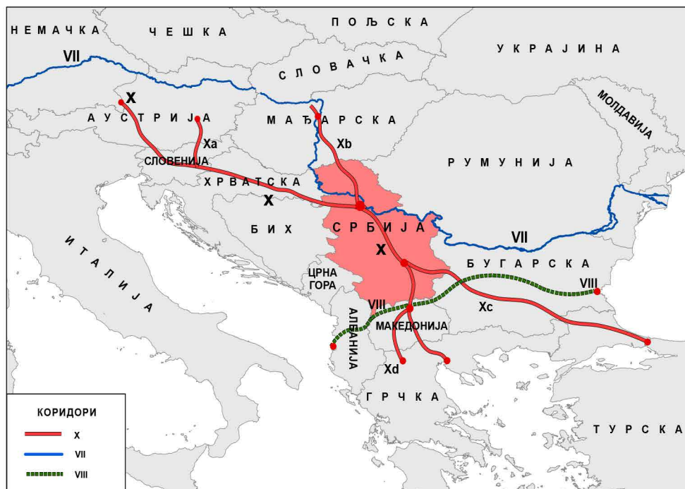
Паневропски коридори од геостратешког значаја за Србију

У саобраћајно-транзитном смислу првостепени значај Србије као геополитичког средишта балканског полуострва је неоспоран. Наиме, од десет паневропских транспортних коридора, који спајају просторе континента од виталног стратешког значаја за Европу, три су од битног геостратешког значаја за геопростор Србије 11 (Карта). То су коридори X, VII и VIII. Оса коридора X иде од Салцбурга према Љубљани и Загребу, затим до Београда и даље ка Солуну и Истамбулу. Један крак тога коридора пролази од Будимпеште до Београда, одакле се уклапа у западноевропску и централнобалканску стратешку трансверзалу. Коридор X повезује осам држава, а укључујући краке још неколико држава. Од укупне дужине путева (2.360 km), Србијом пролази око 800 km. Посредно, преко овог коридора Србија гравитира ка коридору пет (од централне Европе до северног Јадрана) и коридору четири (Будимпешта – Букурешт – Црно море).