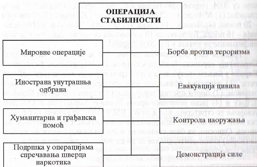
Шема – Типови операција стабилности

Те операције (шема) могу да се изводе пре избијања непријатељстава, у кризним ситуацијама, у току непријатељстава или након њих, а реализују се кроз један од осам типова: (1) мировне операције; (2) инострана унутрашња одбрана; (3) хуманитарна и грађанска помоћ; (4) подршка операцијама спречавања шверца наркотика; (5) борба против тероризма, (6) евакуација цивила, (7) контрола наоружања и (8) демонстрација силе.