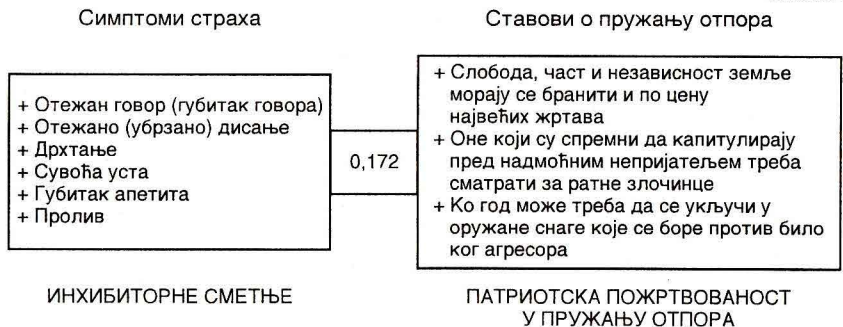
Структура првог каноничког пара

Резултати каноничке корелационе анализе наведени у табели 13 показују да други канонички фактор из скупа варијабли симптома страха у ситуацији агресије („А 2 “) највише корелира са несаницом (0,521), с једне стране и осећањем глади (-0,256) и жмарцима у стомаку (-0,231), с друге стране. Сходно томе, тај канонички фактор може да се дефинише као тешкоће са сном наспрам осећања глади .