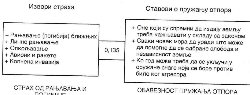
Структура другог каноничког пара 6

Трећи канонички фактор скупа извора страха у ситуацији агресије („А 3 “) у позитивној је корелацији са страхом од несташице струје и воде (0,571), експлозије бомби (0,226) и страхом од рањавања (0,221). Сходно томе, тај фактор је одређен као страх од угрожавања живота и животних потреба (табела 10).