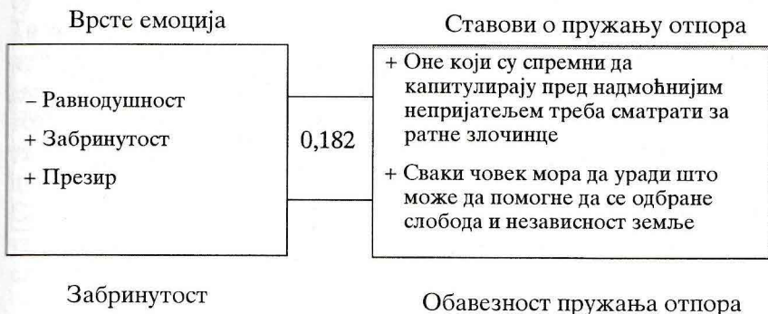
Структура другог каноничког пара

Неравнодушност, забринутост и презир чине такво емоционално стање особе у којем су истовремено садржани негативно вредновање ситуације у којој се она налази, очекивана угроженост и ниподаштавање потенцијалног угрожаваоца. Све три емоције имају енергетски потенцијал у функцији одбрамбених активности, али на нивоу превентивне приправности за спречавање неповољних околности уколико се оне заиста и догоде. Они који презиру немају жељу да противника и физички униште, забринутости одлажу своју активност и очекују да се угрожавање отклони на неки други начин, а неравнодушни ишчекују додатни импулс да би се активирали у правцу противника. С обзиром на такву природу емоционалних реакција типа неравнодушности – забринутости , може се очекивати од таквих људи да преферирају легитимно решавање ситуација у којима су угрожени. Уколико се на такав начин не би отклонила опасност, били би спремни да се и објективно укључе у пружање отпора агресору.