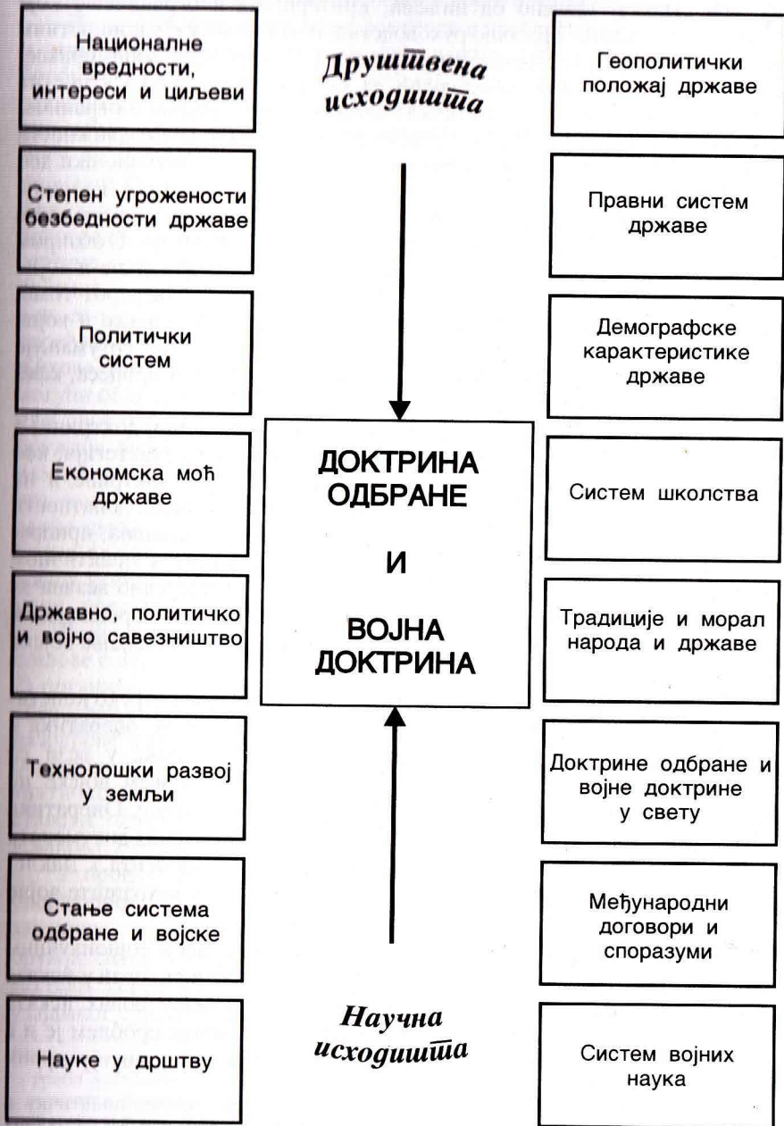
Исходишта доктрине одбране и војне доктрине