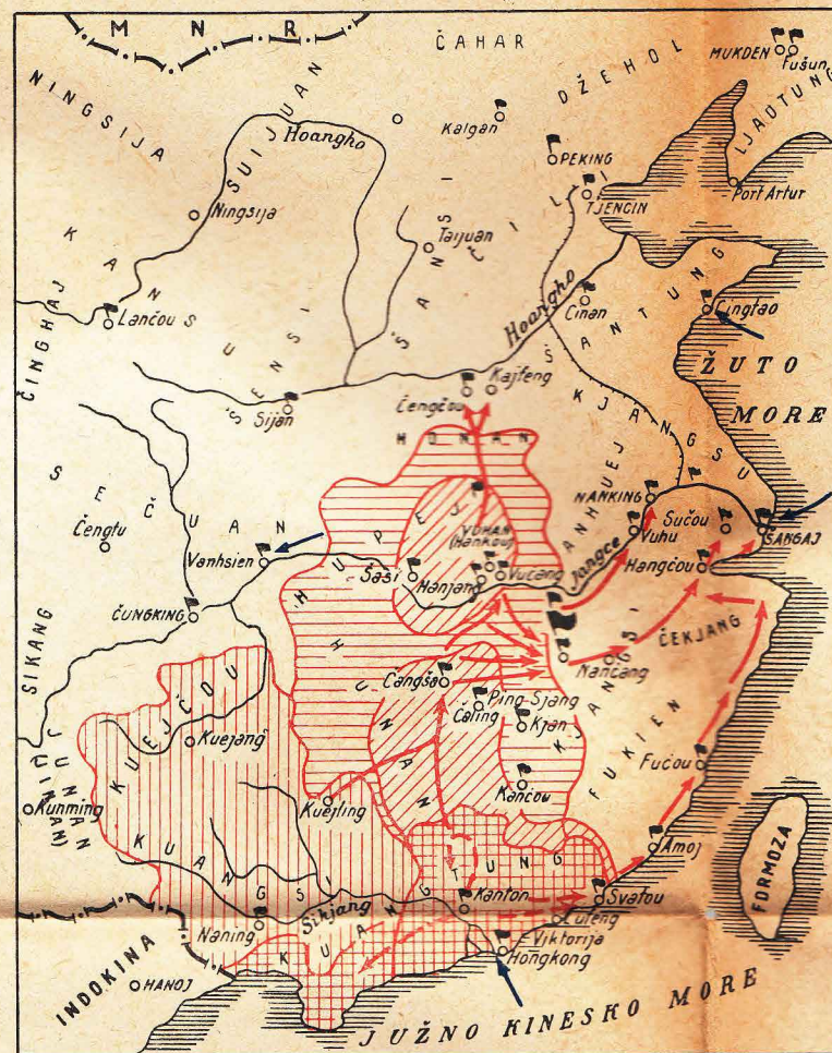
PRVI GRAĐANSKI REVOLUCIONARNI RAT U KINI (1924-1927)