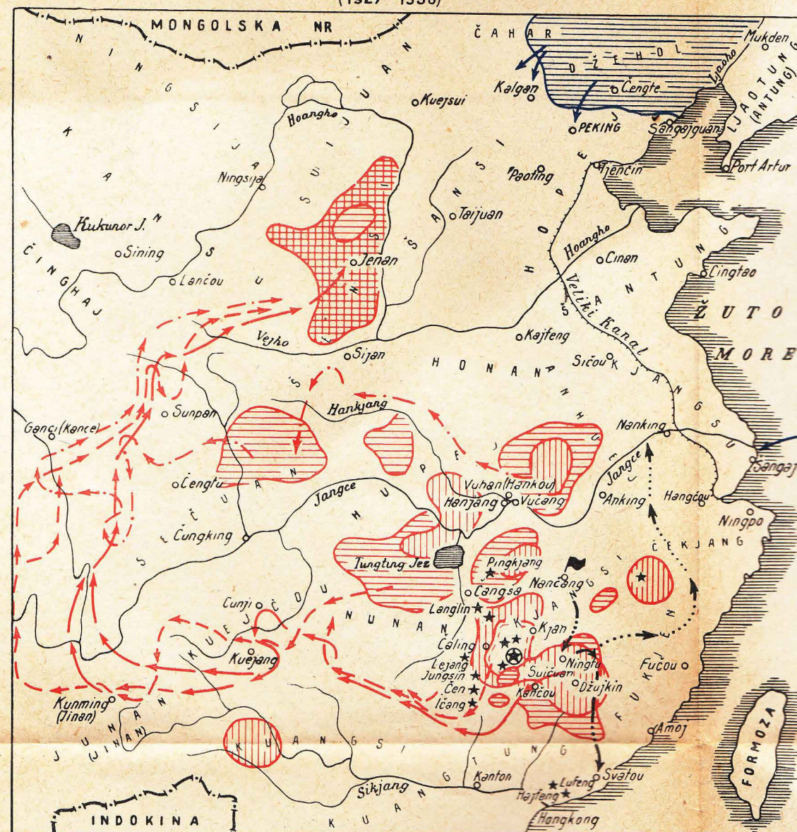
DRUGI GRAĐANSKI REVOLUCIONARNI RAT U KINI (1927-1936)